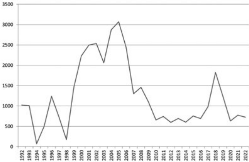
चित्र 1 : रूस से चीन को हथियार निर्यात, 1992-2022 (मूल्य $ मिलियन में)

स्रोत : एसआईपीआरआई आर्म्स ट्रांसफर डेटाबेस 60