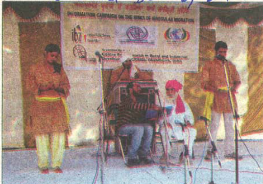
ਕਾਨੂੰਨੀ ਤੇ ਸੁਰੱਖਿਅਤ ਪ੍ਰਵਾਸ ਸਬੰਧੀ ਸੈਮੀਨਾਰ ਉਪਰੰਤ ਖੇਡੇ ਗਏ ਨਾਟਕ 'ਠੱਗੀ-ਠੱਗੀ-ਠੱਗੀ' ਦੀ ਇੱਕ ਝਲਕ।