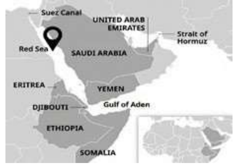
(उत्तर पश्चिमी हिंद महासागर)

माध्यम से, खुद को एनडब्ल्यूआईओ की भू-राजनीति में पाता है।