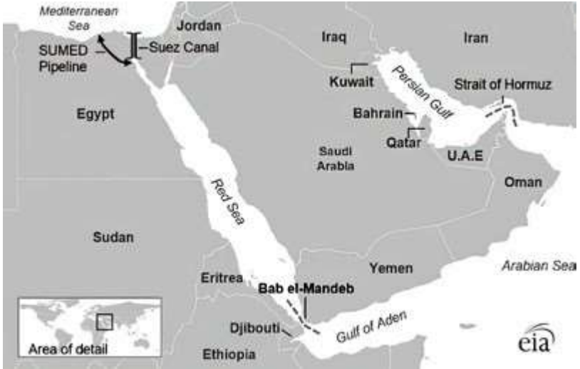
(The Strait of Bab-el-Mandeb)

20वीं शताब्दी के पूर्वार्ध में, औपनिवेशिक शक्तियों ने एनडब्ल्यूआईओ में उपनिवेशों का अधिग्रहण करने के लिए एक दूसरे के साथ प्रतिस्पर्धा की। इस प्रतियोगिता में ब्रिटेन, फ्रांस और इटली सबसे सक्रिय भागीदार थे। ब्रिटेन मिस्र, सूडान, सोमालिलैंड और यमन पर नियंत्रण हासिल करने में कामयाब रहा। अदन (यमन) में चौकी ब्रिटिश साम्राज्यवादी रणनीति में एक महत्वपूर्ण रणनीतिक चौकी थी। फ्रांस ने फ्रांसीसी सोमालिलैंड के क्षेत्र में अपना दबदबा स्थापित किया जिसे बाद में जिबूती नाम दिया गया जबकि इटली ने इरिट्रिया और सोमालिया पर कब्जा कर लिया। 1890 के दशक में इथियोपिया पर अधिकार करने के इतालवी प्रयास विफल रहे। हालाँकि, इटली ने 1930 के दशक के अंत में संक्षिप्त रूप से इथियोपिया को नियंत्रित किया (वुडवर्ड 2002)। द्वितीय विश्व युद्ध के बाद, पश्चिम एशिया के "ऊर्जा गढ़" के रूप में उभरने से एनडब्ल्यूआईओ के सामरिक महत्व में वृद्धि हुई। स्वेज नहर का महत्व पश्चिमी दुनिया की ऊर्जा सुरक्षा के लिए एक प्रमुख धमनी के रूप में तेजी से बढ़ा है। शीत युद्ध के दौरान,